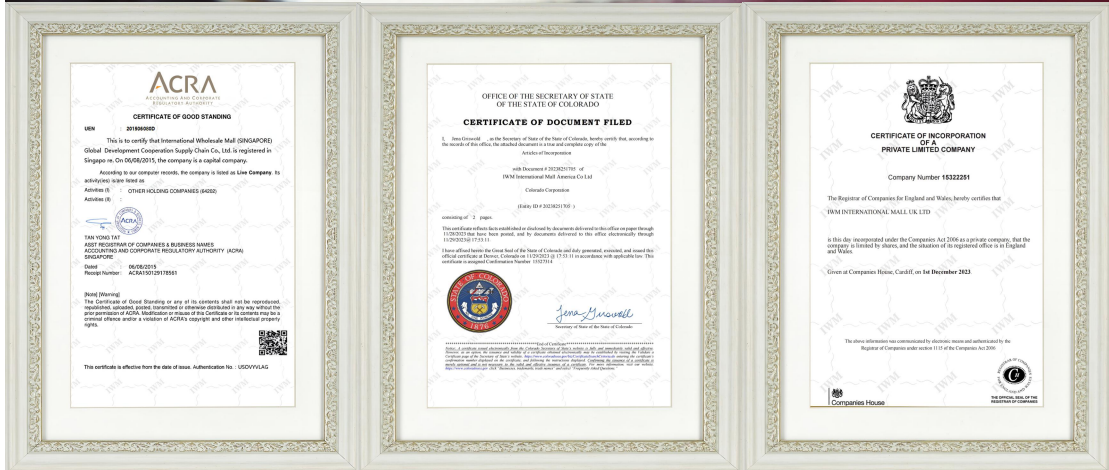
Certificado de Singapur